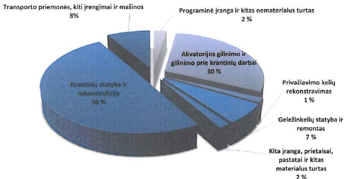
8.1. pav. VĮ Klaipėdos valstybinio jūrų uosto direkcijos investicinių lėšų 2017 m. pasiskirstymas

2017 m. Uosto direkcijos investicijos, įvertinus mokamą ir grąžinamą avansą, sudarė 28,6 mln. Eur . Daugiausia lėšų skirta krantinių statybai ir rekonstrukcijai ( 14,2 mln. Eur ), akvatorijos gilimo darbams ( 8,5 mln. Eur ), geležinkelio kelių statybai ir rekonstrukcijai ( 1,9 mln. Eur ) ir transporto priemonėms, įskaitant naftos produktų surinkimo laivą ( 2,4 mln. Eur ). Kitos lėšos buvo skirtos: programinei įrangai, pastatų rekonstrukcijai, privažiavimo kelių rekonstravimui, įrenginiams, prietaisams ir kitam materialiam ir nematerialiam turtui įsigyti.